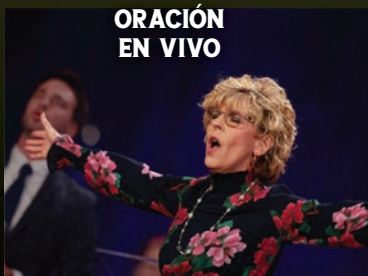
ORACIÓN EN VIVO