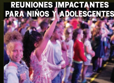
REUNIONES IMPACTANTES PARA NIÑOS Y ADOLESCENTES