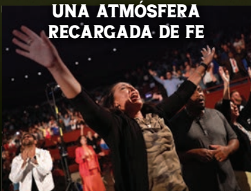
UNA ATMÓSFERA RECARGADA DE FE