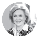
por Gloria Copeland