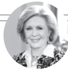
por Gloria Copeland